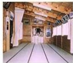
Penginapan di Taishikan