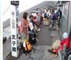
Stesyen ke 8 Gunung Fuji