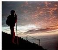
Matahari terbit di puncak Fuji san