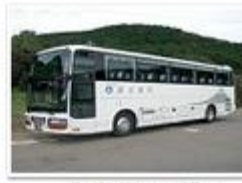
Bas ke Kawaguchiko

Hari 04 (3 Julai 2011/Ahad) – Seawal 12:30 pagi mula mendaki kembali untuk ke puncak (3,776m). Tiba di puncak pada 3:30 pagi untuk menikmati matahari terbit. Cuaca di puncak adalah sangat sejuk (7c). Pada pukul 6:00 pagi mula untuk perjalanan turun ke stesen ke 5 Fuji –san Tiba di stesen ke 5 sekitar 10:30 pagi. Berehat dan membeli cenderahati. Menaiki bas ke stesen Kawaguchiko. Mengambil beg di Kawaguchiko Inn. Menaiki bas ke stesen Shinjuku. Menaiki keretapi ke Ikebukuro untuk ke hostel penginapan. Acara bebas.