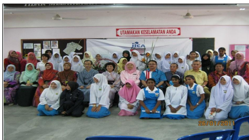
PHOTOS TAKEN DURING THE IKEBANA DEMONSTRATION AT SMK SEKSYEN 4 KOTA DAMANSARA, PETALING JAYA.

The workshop received tremendous support from both the students and teachers of the school and hope that more of this demonstration and other similar programmes would be held from time to time to have a closer relationship between the people of Japan and Malaysia