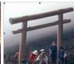
Torii Gate di Fuji san